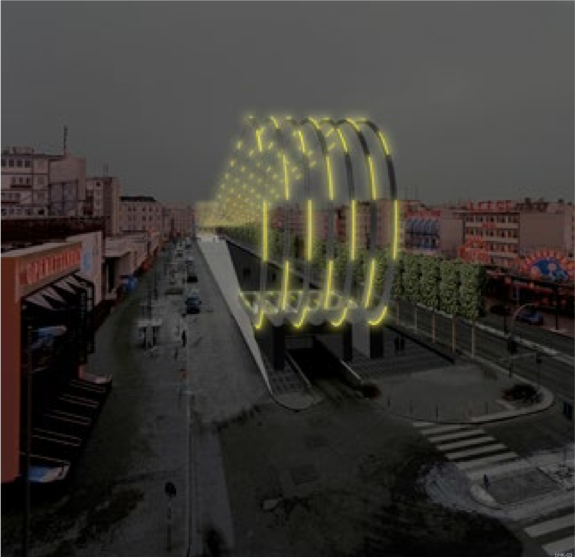
„Tag und Nacht“, Spielbudenplatz Hamburg (internatio- naler Wettbewerb mit Büro Bauer, engere Wahl), 2004