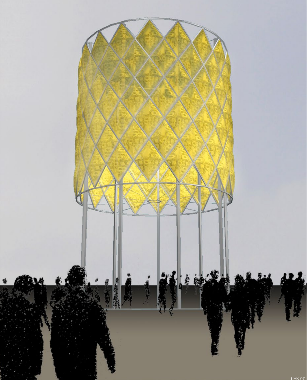
„Der Flaneur und das Rondell“, Wien (Wettbewerb mit rheinflügel, 1.Preis), 2004