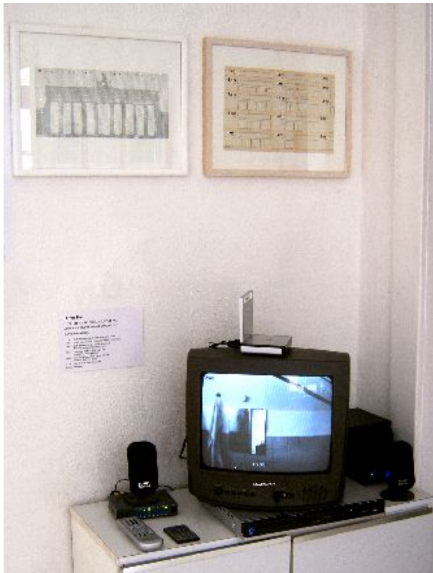
Abbildung 3: Dieter Paul: Kamerainstallation