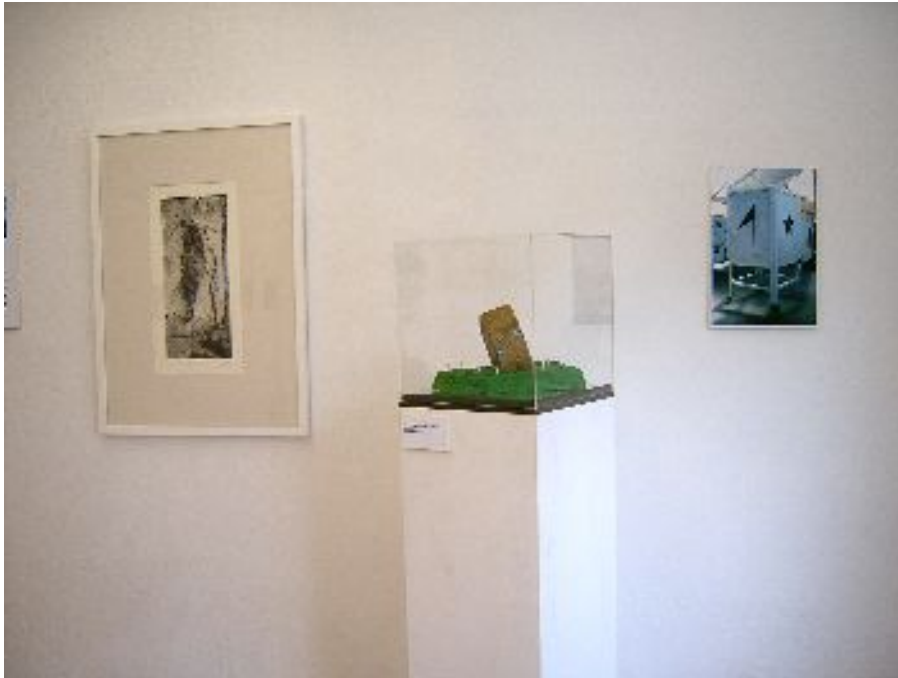
Abbildung 8: Gunter Klag: Ausstellungsansicht

bHK Hauptstraße 129 D-76756 Bellheim Tel: 0177-5620479 (Heuchel) Tel.: 07272-76158 (bHK-Klag) info@bureau-heuchel-klag.de, www.bureau-heuchel-klag.de