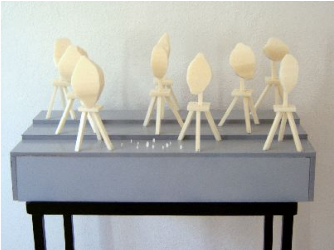
Abbildung 7: Christian Heuchel: Landschaftsmodell