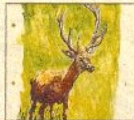
„Jagdbild“ von Mike Überall.