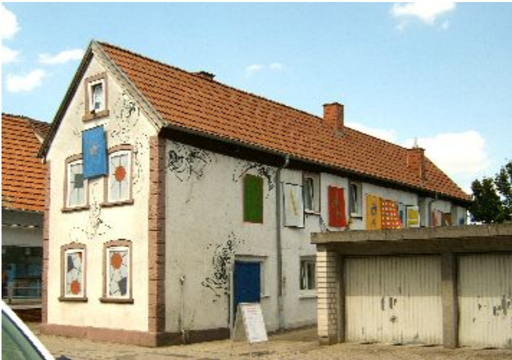
Abbildung 9: Gunter Klag: Kunsthaus mit Bannern