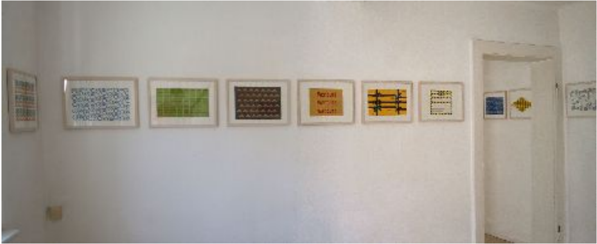
Abbildung 2: Dieter Paul: Ausstellungsansicht

bHK Hauptstraße 129 D-76756 Bellheim Tel: 0177-5620479 (Heuchel) Tel.: 07272-76158 (bHK-Klag) info@bureau-heuchel-klag.de, www.bureau-heuchel-klag.de