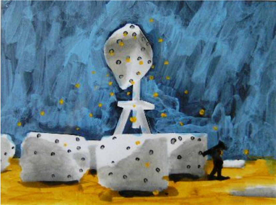
Abbildung 6: Christian Heuchel "Große Ernte"

bHK Hauptstraße 129 D-76756 Bellheim Tel: 0177-5620479 (Heuchel) Tel.: 07272-76158 (bHK-Klag) info@bureau-heuchel-klag.de, www.bureau-heuchel-klag.de