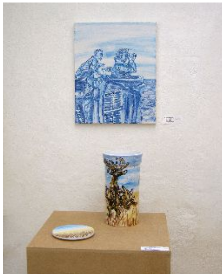
Abbildung 5: Mike Überall: Weinkühler und Fayence