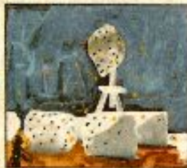
Modell von Christian Heuchel.